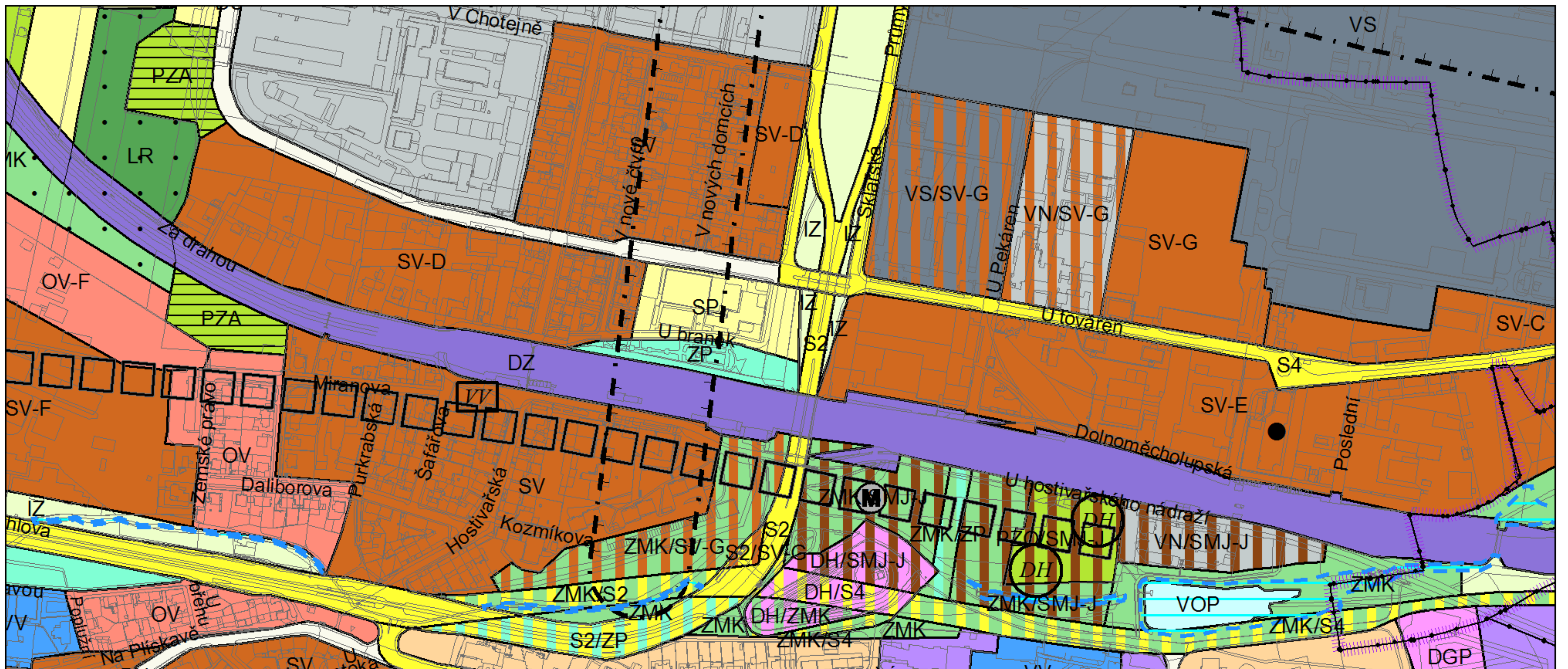
Promítnutí změny do výkresu č. 4 - Plán využití ploch