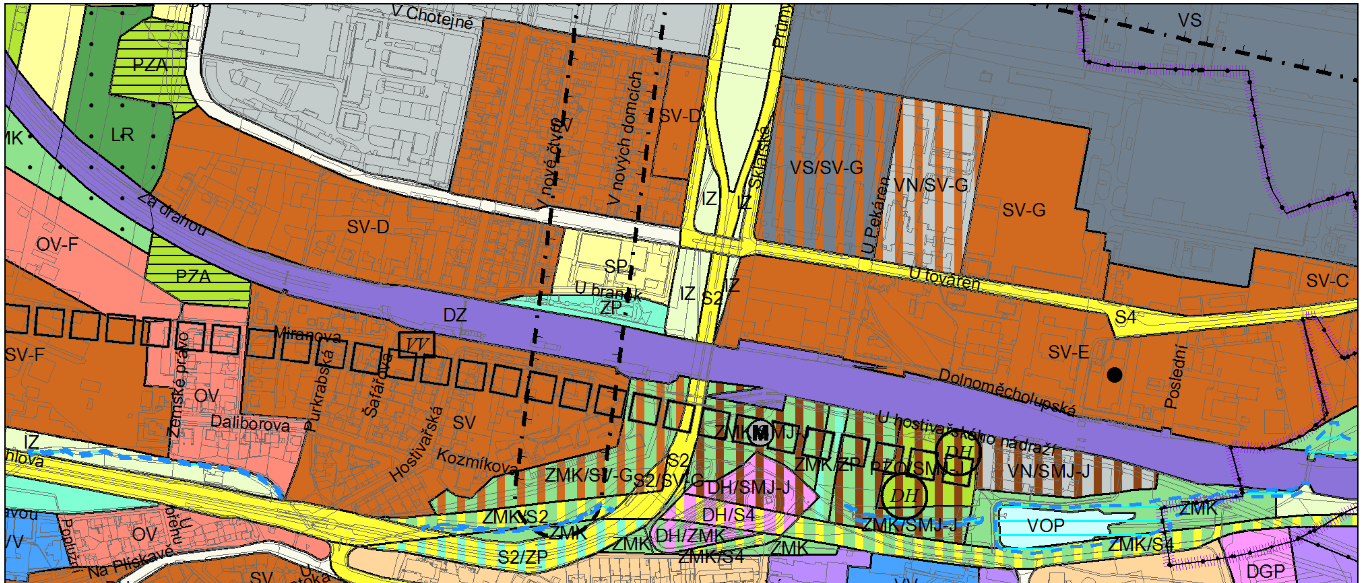
Výkres č. 4 – Plán využití ploch, platný stav k 1. 1. 2017